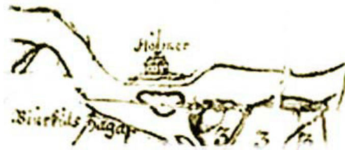
Nedanför: Översiktskarta över Högsby, Åsebo och Ruda.