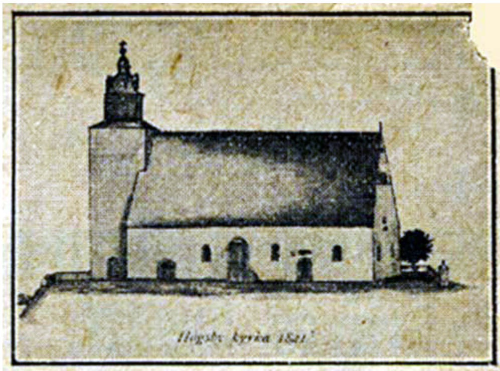
Teckningen visar Högsby kyrka, sådan denna var efter ombyggnaden 1774. Teckningen är gjord 1821 av prosten Löfgren, då 24-årig teol. studerande.